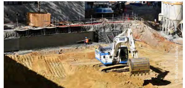
Le béton est lissé à la règle pour donner au mur son aspect définitif.

On peut enfin passer à la partie inférieure du mur grâce à la technique du « butonage » : elle consiste à caler la partie du mur déjà construite avec des étais appelés « butons ». Placés à 45°, ces gros troncs d'arbres soutiennent le mur supérieur pendant que l'on procède à la construction de la partie inférieure selon la même technique que décrite ci-dessus.