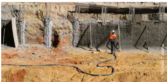
Avec sa lance, l'ouvrier va projeter du béton sur le treillis métallique