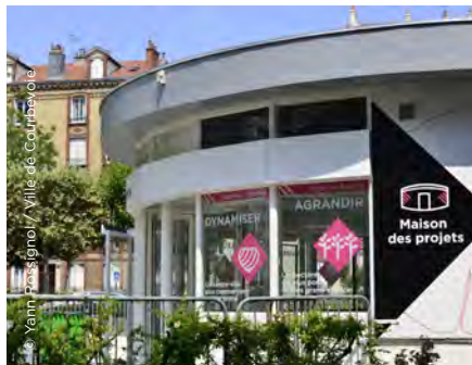
La Maison des projets se situe rue Baudin.

La Maison des projets est un lieu d'information et d'échange. Dans le cadre des