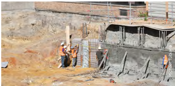
La tête des cinq pieux a été dégagée du sol. Celui de gauche a été « pioché ».

Au fur et à mesure du creusement, la tête des pieux apparaît : elle est alors piochée pour permettre une bonne adhésion du béton à venir. On place ensuite un treillis de ferraille entre les pieux - l'armature du mur - et l'on projette du béton sur cet ensemble au moyen de lances (comme des tuyaux d'arrosage) connectées à l'usine à béton installée sur place (les 4 grandes cuves situées au fond du trou). Le mur ainsi constitué est alors lissé à la règle par les ouvriers.